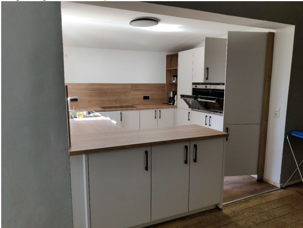
Blick in die Küche vom Aufenthaltsraum aus.

Bei Beschädigungen oder fehlenden Teilen von Geschirr, Besteck, Kochutensilien oder Elektrogeräten stellen wir Ihnen auch hier die Ersatzbeschaffungskosten in Rechnung. Das gleiche gilt für fehlende Spannbetttücher