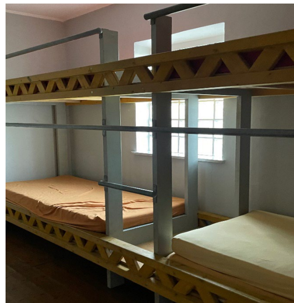
Unsere Schlafräume: linkes Bild der 12-er Schlafräum, rechts der 10-er Raum mit den 2 Betten unten mit niedrigem Einstieg.