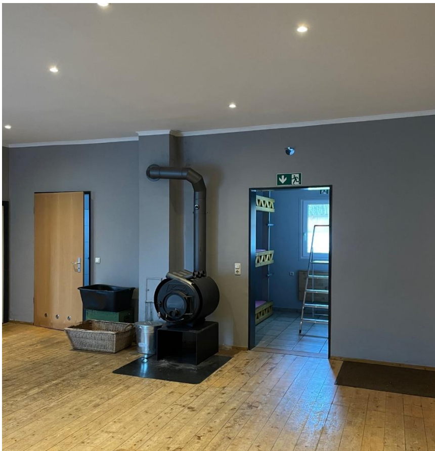
Aufenthaltsraum mit Holzofen

Beim Umgang mit Zündmitteln, offenem Feuer oder Licht in der Einrichtung ist zu sichern, dass brennbare Stoffe nicht durch Flammen oder Glut entzündet werden können.