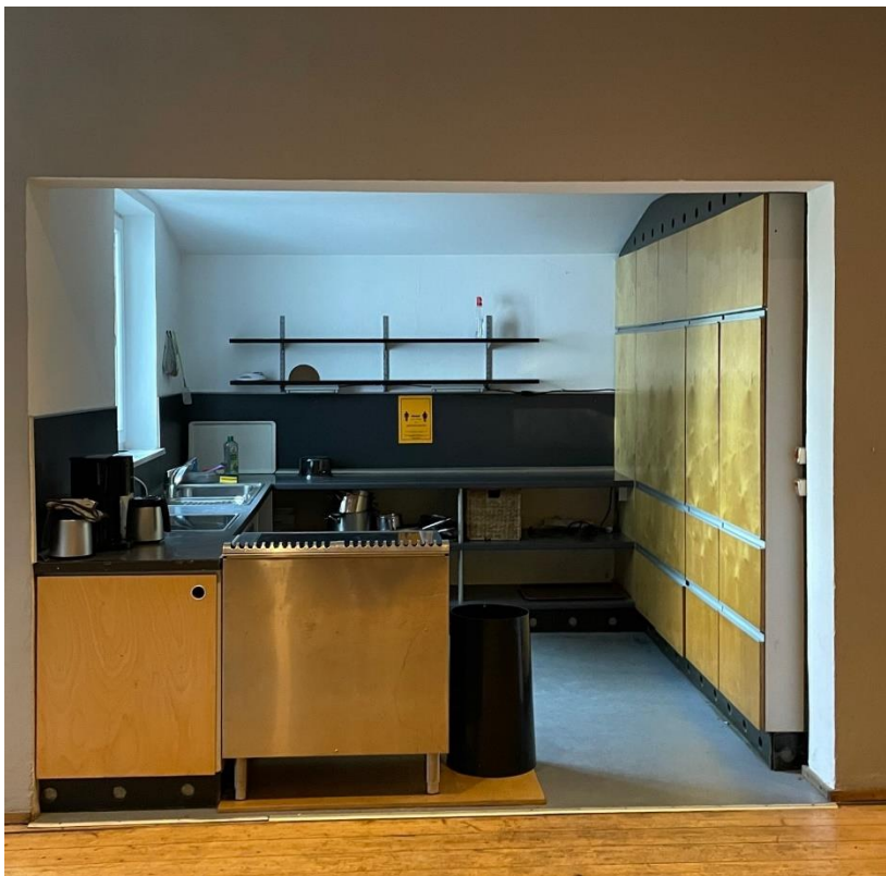
Blick in die Küche vom Aufenthaltsraum aus.

Bei Beschädigungen oder fehlenden Teilen von Geschirr, Besteck, Kochutensilien oder Elektrogeräten stellen wir Ihnen auch hier die Ersatzbeschaffungskosten in Rechnung. Das gleiche gilt für fehlende Spannbetttücher